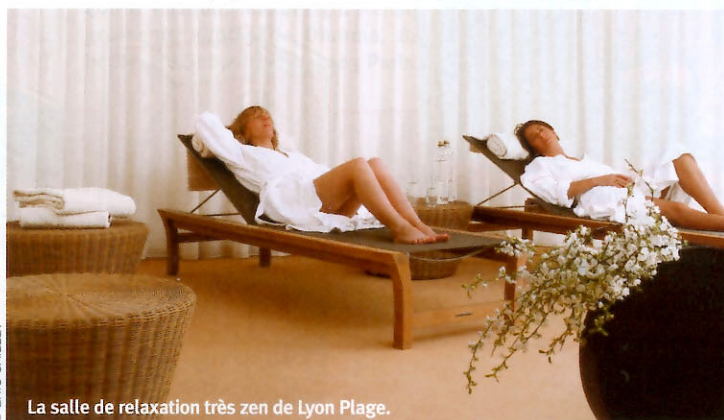
La salle de relaxation très zen de Lyon Plage.

et hauteur sous plafond) avec des meubles signés Starck (fauteuils Louis Ghost... ), Hugues Chevalier (les banquettes) ou Gilles Oudin (lampes industrielles)... Au rez-de-chaussée, les cours ont lieu sous une rotonde ornée d'un dôme serti de calots de verre coloré, qui distille une