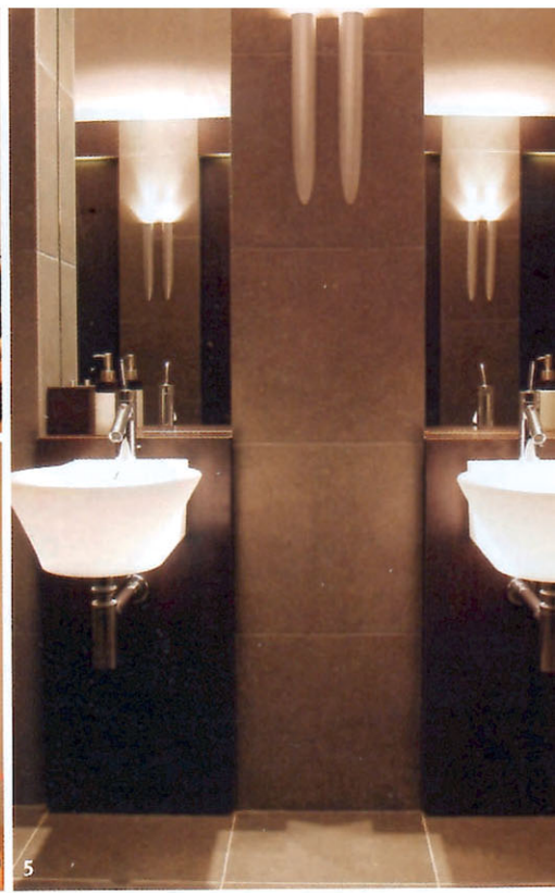
1/ Le Lounge du Wellness Attitude, une bulle de quiétude après l'effort. 2/ L'espace kids de Lyon Plage, un concept inédit dans un décor vitaminé ! 3/ et 4/ Chez Art et Pilates, les traditionnels miroirs ont été avantageusement remplacés par des œuvres d'art contemporain. 5/ Un soin extrême a été apporté à la réalisation des vestiaires pour hommes du Wellness Attitude.

ambiance féérique. Des néons (Ar Luminis) éclairent les murs blancs de leur lumière bleutée presque céleste. A l'étage, la salle des appareils en érable jouit d'une belle clarté grâce à sa large verrière. Chaque espace accueille dix élèves pendant 55 minutes d'étirement pour une silhouette affinée et un mental apaisé.